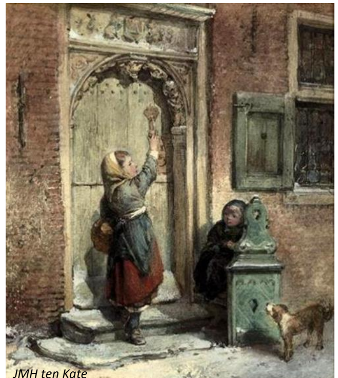
JMH ten Kate

Tuur en Gust: Mercie zè, tentj'n, tot noste weik! Tein komt ons va en ons moe a nievejaur wénsjken!